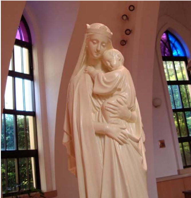
聖母子像 Sedes Sapientia □ (部分) 学園聖堂