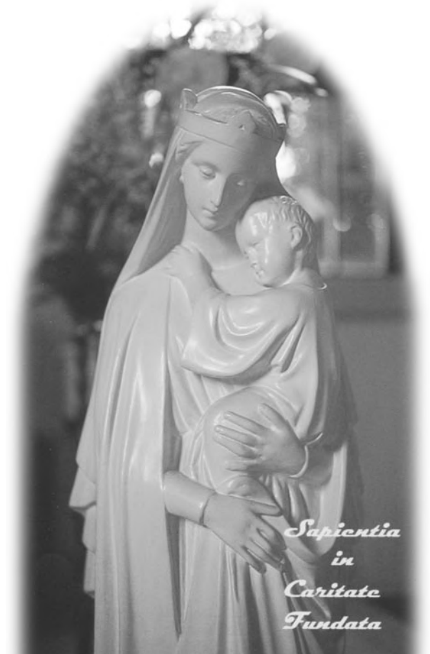
学園聖堂の聖母マリア像

国境や人種、思想・信条を超えて人々や事柄を理解し共感をもってかかわるためには、幅広い教養と柔軟な感性が求められています。本学の教養教育および感性教育は、この要求に応えます。